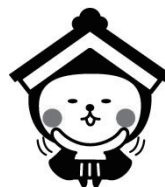
栃木市マスコットキャラクター とち介(とちすけ)