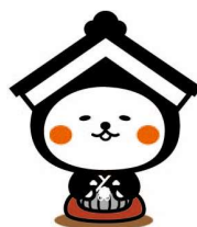
栃木市マスコットキャラクター とち介 (とちすけ)